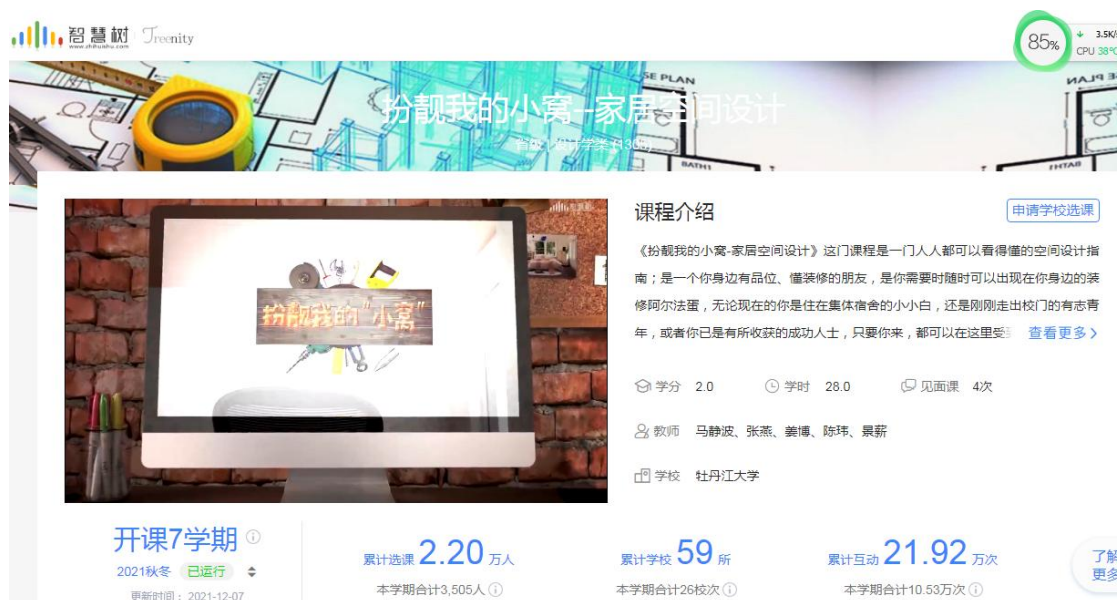
图 5 扮靓我的小窝在线课程

2018-2019 年校企师傅共建《扮靓我的小窝》在线课程，该课程 2019 年被评为省级精品在线开放课程，并在智慧树平台上线，学生对有丰富实践经验的企业师傅参与授课的在线课程非常欢迎，授课过程学生既能听到学校老师诙谐幽默的理论知识传授，也能得到企业师傅扎实实践技能的指导。