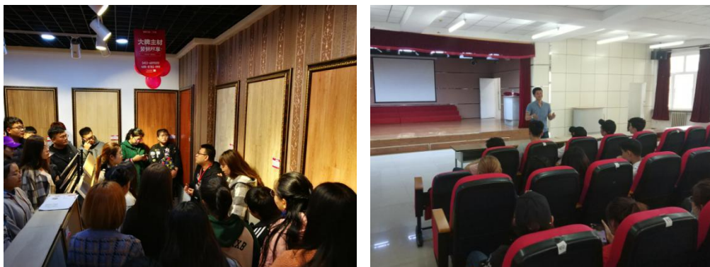
图4 共享型实训基地

（四）共建共享实训基地。双方共同投入资金建设共享实训基地，“共用共管”资源使用率大大提高。