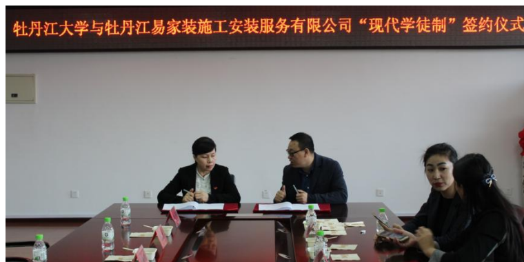
图 1 牡丹江大学与企业签约仪式

（一）校企共研招生招工模式。双方通过各自网站发布招生招工一体化及试点班班额信息，在新生入校后组织宣讲、面试考核方式成立试点班，明确试点班学员双重身份，建立末位淘汰机制；签署“校企生”三方协议，进一步明确三方权责。