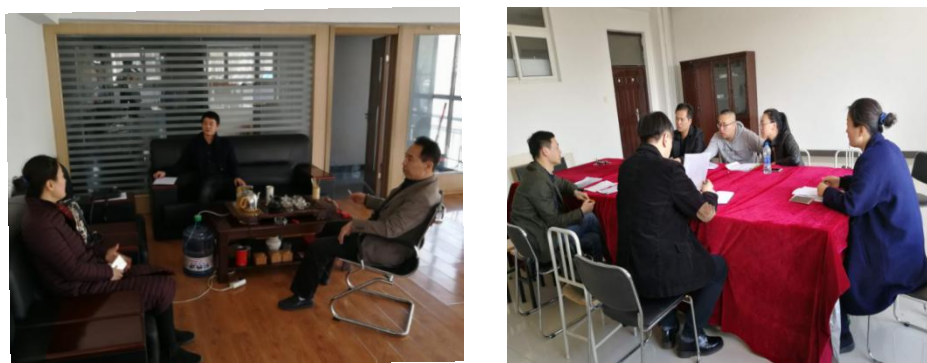
图 2 与企业商讨人才培养目标

(一) 共同设计专业人才培养方案。根据学徒岗位需求，校企联合设计学生在学校和企业的学习内容、教学安排、教学形式和教学方法等环节，通过试点工作实际，不断优化教学安排和教学手段。