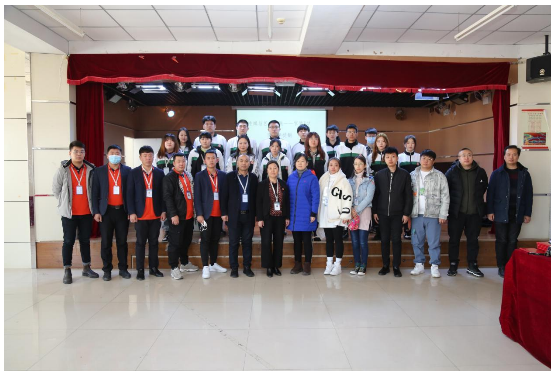
图7 建筑室内设计专业拜师仪式师生合影

2019级建筑室内设计专业提出申请的40名学生赴家装驿站开展了企业实践活动，分别进入了市场部，设计部，施工部等相关工作岗位开展了顶岗实践。